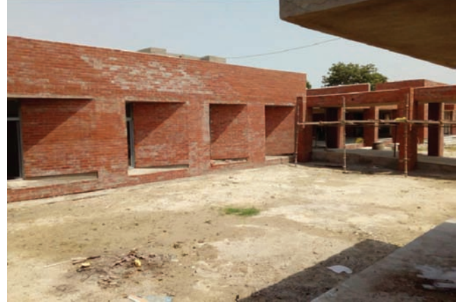
मुख्य भवन (प्रशासनिक खंड) – कोल्हुआ (वैशाली)

अब तक सभी सिविल कार्य पूरे हो चुके हैं, केवल फीनिशिंग और सफाई का काम चल रहा है। प्रदर्शनी वीथिका का काम हो चुका है जहाँ फर्नीचर शीघ्र ही लगा दिया जाएगा।