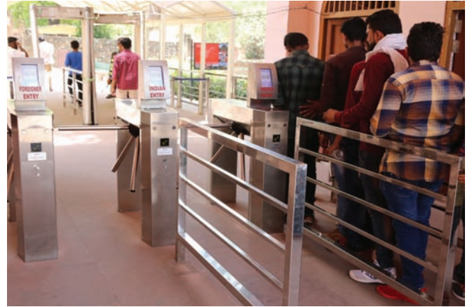
कुतुब मीनार, नई दिल्ली के प्रवेश बिंदु पर चक्रद्वार टिकटिंग