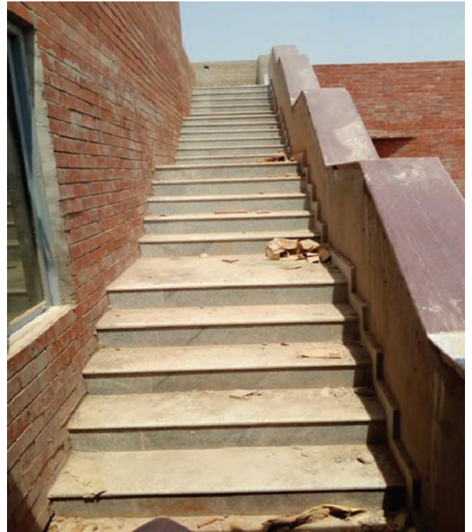
जलपान गृह/वीथिका/श्रव्य दृश्य खंड