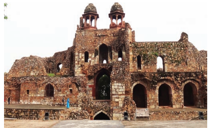
पुराना किला, दिल्ली

एन बी सी सी “पुराना किला, नई दिल्ली का संरक्षण, विकास और अनुरक्षण” की परियोजना के समर्थन के लिए सहमत है और अपने सी एस आर के अंतर्गत अगले 5 वर्षों में 14.35 करोड़ रु. तक की निधि प्रदान करेगा। समझौता ज्ञापन हस्ताक्षर की तिथि से तीन वर्ष की अवधि के लिए वैध होगा और इसे समझौता ज्ञापन के पक्षों के परस्पर निर्णय पर और अधिकतम 2 वर्ष की अवधि के लिए बढ़ाया जा सकता है।