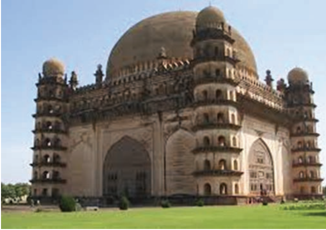
गोल गुम्बद, बीजापुर

परियोजना विवरण : इब्राहिम रौजा और गोल गुम्बद, बीजापुर के बागों को हरा-भरा करना