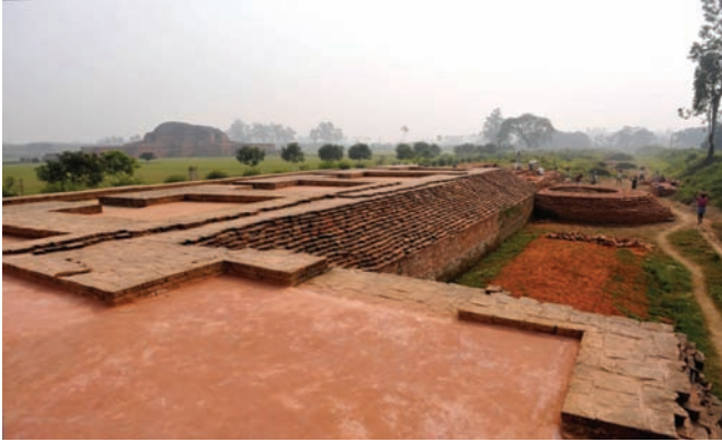
विक्रमशिला विश्वविद्यालय स्थल, बिहार

यह पाल वंश के दौरान भारत के दो सबसे महत्वपूर्ण बौद्ध अध्ययन केन्द्रों में से एक था, दूसरा नालंदा विश्वविद्यालय था। नालंदा विश्वविद्यालय में छात्रवृत्ति की गुणवत्ता में तथाकथित कमी आने के प्रतिक्रियास्वरूप विक्रमशिला की स्थापना राजा धर्मपाल (783 से 820 ई.) ने कराया थी। विक्रमशिला बिहार में भागलपुर से लगभग 50 कि.मी. पूर्व दिशा में स्थित है।