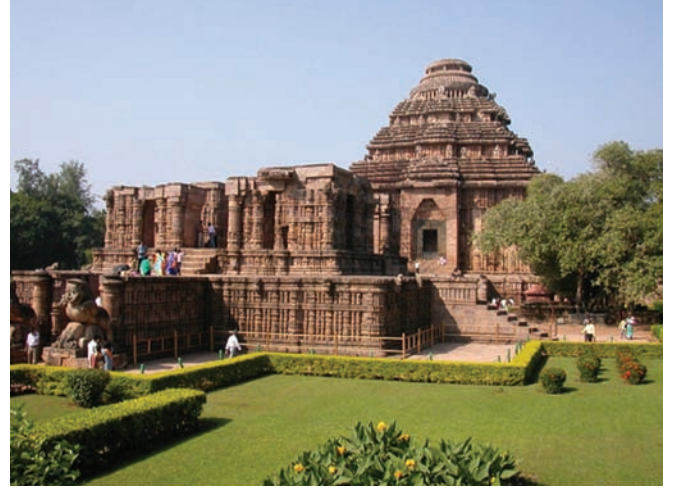
सूर्य मंदिर, कोणार्क

(नृत्य कक्ष) है। समय के साथ गर्भ गृह और नाट मंदिर का छत गायब हो गया है। नाट मंदिर अन्य उड़िया मंदिरों से अधिक संतुलित वास्तुगत डिज़ाइन को प्रदर्शित करता है। गर्भगृह तीन प्रक्षेपणों में सूर्य देवता के भव्य तस्वीर को प्रदर्शित करता है, जिसे सूक्ष्म मंदिर माना जाता है।