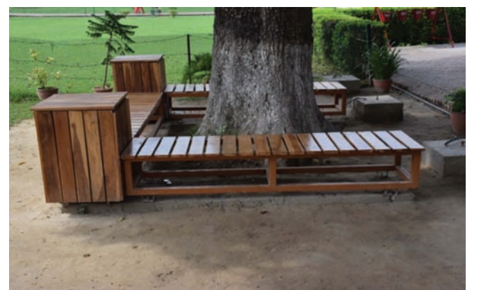
बैठने का प्लाजा