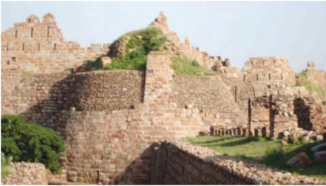
तुगलकाबाद किला, दिल्ली

मैसर्स गेल ने तुगलकाबाद किला परियोजना के लिए 30 लाख रु. का अंशदान दिया है।