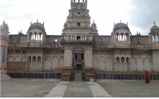
मंदिर में भित्ति चित्र, पुष्कर