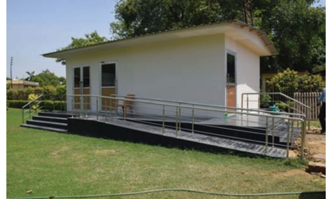
संग्रहालय का सुरक्षा कक्ष