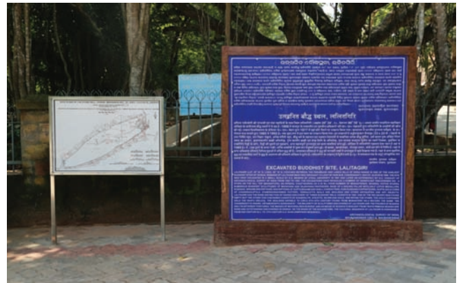
स्थल पर संकेतक