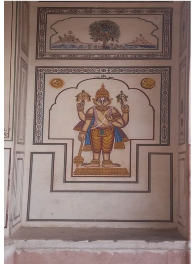
पुराना रंगजी मंदिर, पुष्कर

एन सी एफ की लघु अनुदान योजना के तहत पुष्कर राजस्थान स्थित पुराना रंगजी मंदिर के संरक्षण के लिए विस्तृत परियोजना रिपोर्ट की तैयारी हेतु एन सी एफ और मै. द्रोहर (परामर्शदाता) के बीच संगम ज्ञापन पर 14.10.2014 को हस्ताक्षर किया गया है।