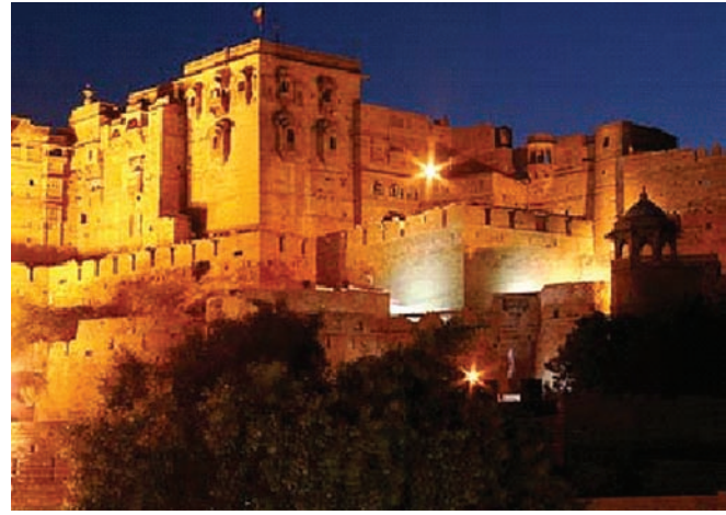
जैसलमेर किला, राजस्थान

किले के भीतर सांस्कृतिक विरासत संसाधनों का संरक्षण और प्रबंधन योजना निर्माण।