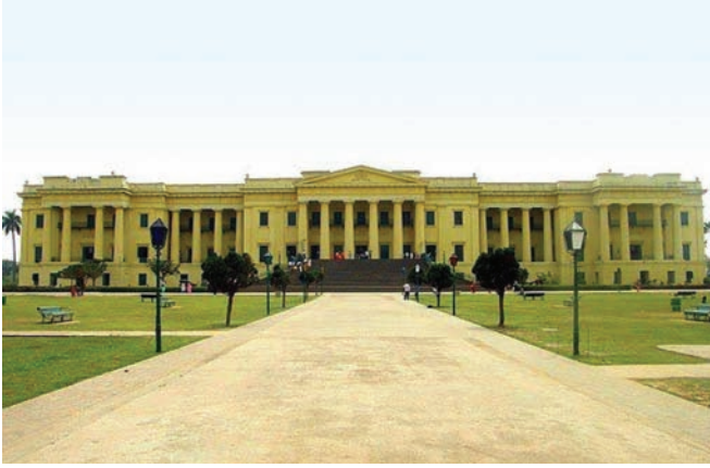
हजारद्वारी महल, मुर्शिदाबाद, पश्चिम बंगाल

इसके ऊपर चढ़ा जा सकता है। हजारद्वारी महल वर्ष 1977 में भारत सरकार के राजपत्र में प्रकाशित अधिसूचना द्वारा राष्ट्रीय महत्व का केन्द्रीय संरक्षित स्मारक घोषित किया गया था और इसके अन्दर बने संग्रहालय को 1985 में भारतीय पुरातत्व सर्वेक्षण ने पश्चिम बंगाल सरकार से अपने पास ले लिया था, और काम शुरू किया गया है।