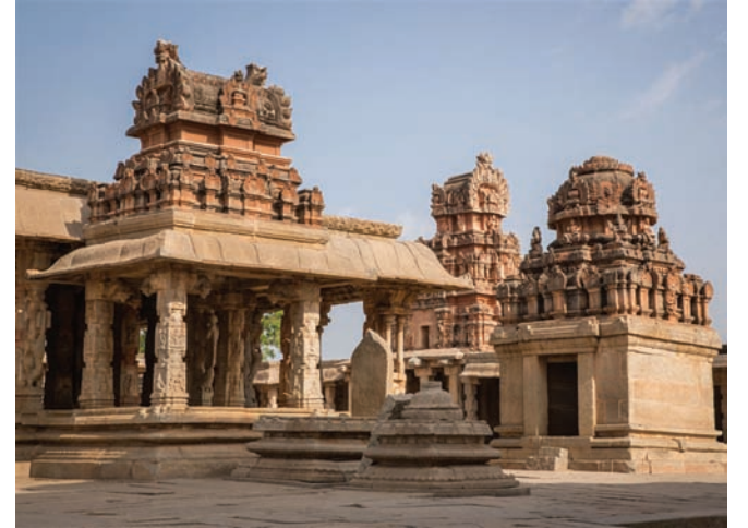
कृष्ण मंदिर, हम्पी

परियोजना विवरण : कृष्ण मंदिर, हम्पी, कर्नाटक का विकास।