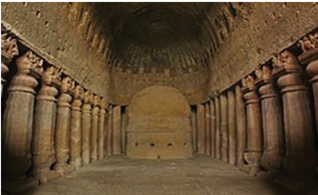
गुफा 3, कन्हेरी गुफाएं, मुंबई

कन्हेरी गुफाएं कटे हुए चट्टान के स्मारकों का समूह है, जो मुंबई के पश्चिम भाग में बोरीवली के उत्तर में स्थित है। प्राचीन अभिलेखों का कन्हेरी, कान्हासेला, कृष्णागिरि, कान्हागिरि प्रमुख बौद्ध केन्द्र था। कन्हेरी थाणे से छह मील दूर साल्सेट द्वीप में स्थित है। गुफाओं की खुदाई समुद्र तल से 1550 फीट ऊंची वोल्केनिक ब्रेसिया पहाड़ियों में की गई हैं। कन्हेरी एकल पहाड़ी में सबसे बड़ी संख्या में खुदी गुफा के रूप में प्रसिद्ध है। पश्चिम में बोरीवली स्टेशन है और छोटी नदी के पार अरब सागर है।