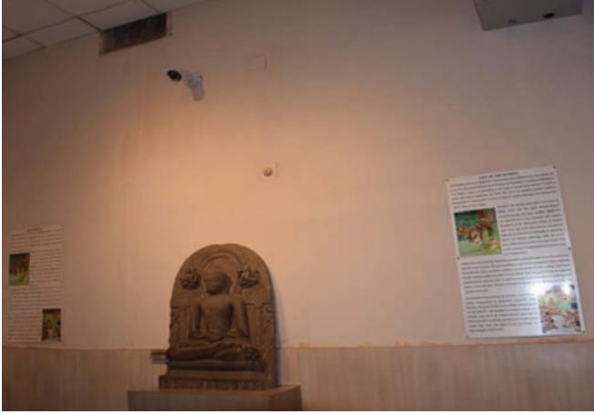
सारनाथ संग्रहालय की वीथिका