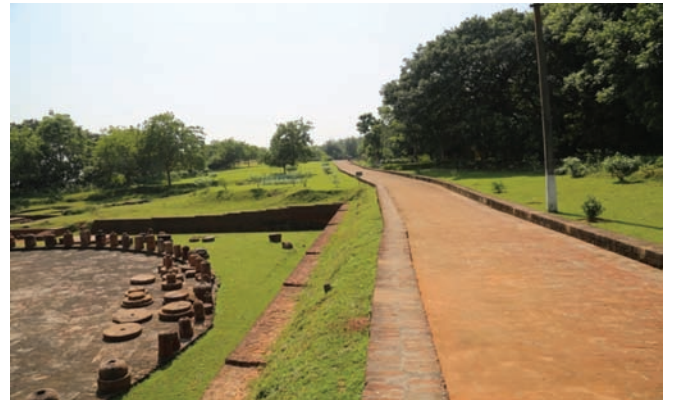
प्रवेश द्वार से स्तूप तक सड़क का निर्माण