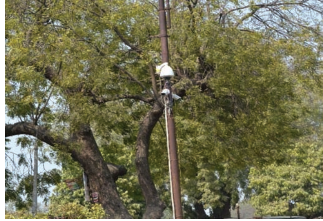
स्थल पर सीसीटीवी कैमरे का संस्थापन