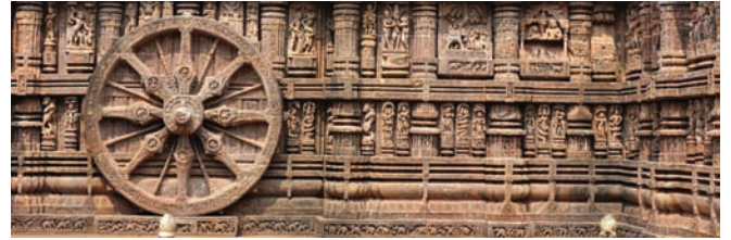
सूर्य मंदिर, कोणार्क की दिवाल पर एक चक्का

इंडियन ऑयल प्रतिष्ठान द्वारा पर्यटन सुविधाओं का विकास :