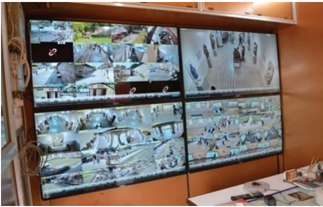
संस्थापित सीसीटीवी कैमरे की निगरानी इकाई