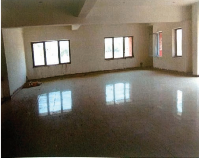
जलपान गृह/विभिन्ता/श्रव्य दृशम खण्ड