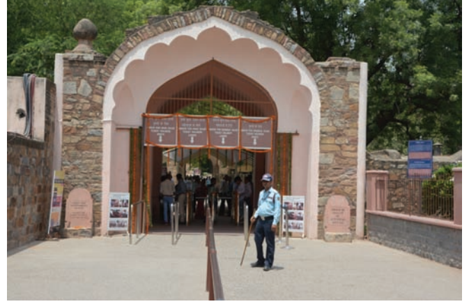
कुतुब मीनार प्रवेश द्वार

चक्रद्वार टिकट प्रणाली को भारत अवसंरचना वित्त कंपनी लिमिटेड (आई आई एफ सी एल) की कारपोरेट सामाजिक जिम्मेदारी (सी एस आर) पहल के तहत वित्तपोषित किया जा रहा है। यह प्रणाली निश्चित रूप से स्मारक परिसरों के भीतर दर्शकों को सुगम प्रवेश प्रदान करेगा। यह व्यवस्था पहले की प्रवेश व्यवस्था की तुलना में बहुत ही क्रमिक और बाधामुक्त है और इसमें कम समय लगता है।