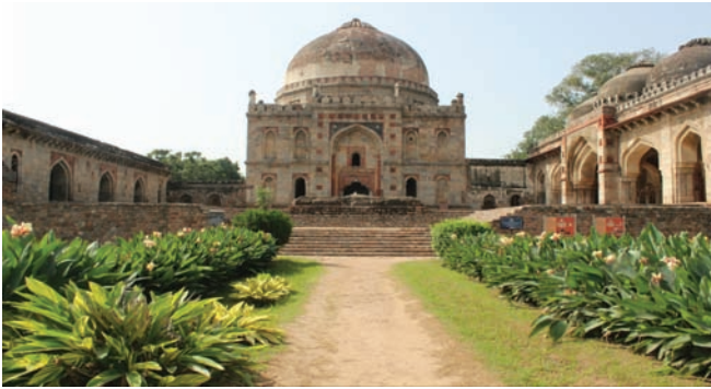
लोधी मकबरा, दिल्ली

परियोजना विवरण : लोधी मकबरा, नई दिल्ली का संरक्षण एवं परिरक्षण।