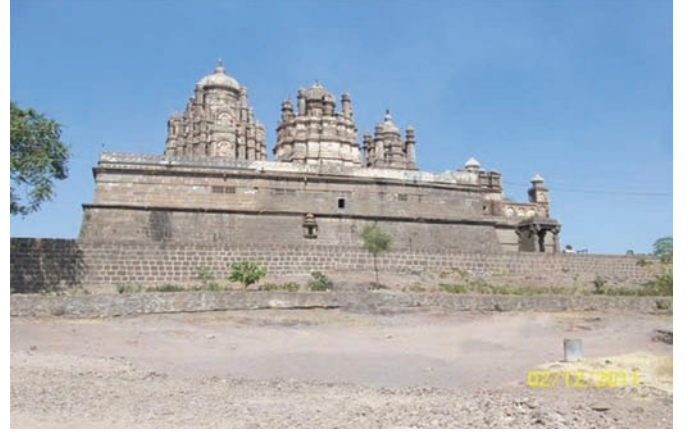
भुलेश्वर मंदिर, पुणे, महाराष्ट्र

परियोजना एस. ए. मुंबई परिक्षेत्र, ए एस आई द्वारा क्रियान्वित की जा रही है।