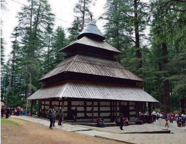
मनाली (हिमाचल प्रदेश) में हिडिम्बा देवी मंदिर

परियोजना विवरण : हिडिम्बा देवी मंदिर में पर्यटक सुविधाओं का सुधार