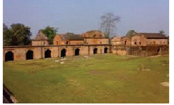
तलातल घर, रंगपुर, असम

शिवसागर, भगवान शिव का सागर, भारत के असम राज्य के शिवसागर जिले में गुवाहाटी से लगभग 360 कि.मी. (224 मील) पूर्वोत्तर में एक कस्बा है। अपने इतिहास, संस्कृति और तालाबों के अलावा यह अहोम महलों और स्मारकों के लिए भी प्रसिद्ध है। इस स्थल के समीप ही ओ एन जी सी संयंत्र है।