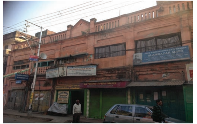
आलमबाजार मठ, कोलकाता

परियोजना विवरण : आलमबाजार मठ का नवीकरण, पुनर्निर्माण।